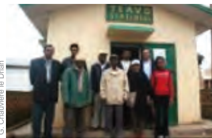
Caisse villageoise Tiavo à Madagascar

La forte nécessité de professionnaliser les réseaux conduit ceux-ci à se poser la question d'une « structure faitière » à partir d'un certain niveau de développement. Si la nécessité technique d'une telle structure est en règle générale bien admise, en dépit des réticences sur le transfert de pouvoirs qu'elle implique, reste le problème de son coût et la capacité du réseau à le supporter.