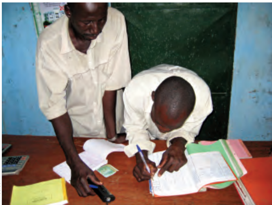
F. Gorse Ouverture d'un compte (Mali)

En milieu rural, la collecte de l'épargne est un service coûteux. Elle donne lieu à de nombreux mouvements de très faible montant obligeant à conserver une encaisse sur place. Pour rentabiliser ce service, les IMF proposent des produits